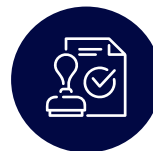
Modèles de licences flexibles

C'est tout ce dont vous avez besoin pour entièrement personnaliser un environnement en fonction de vos besoins d'affaires.