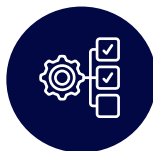
Gestion intelligente des commandes