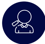
Données sur les clients