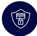
Protection contre la fraude